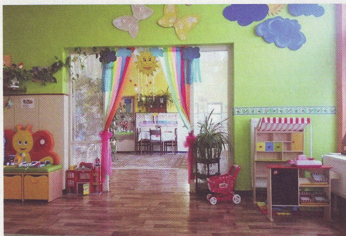
Počas nariadenej prestávky pani učiteľky vynovili učebnice.

Obecná materská škola, podobne ako ostatné skôlky, počas trvania núdzového stavu zavedeného v dôsledku pandémie koronavírusu bola zatvorená. Pre detičky pani učiteľky aj v tomto období pravidelne pripravovali zaujímavé online aktivity.