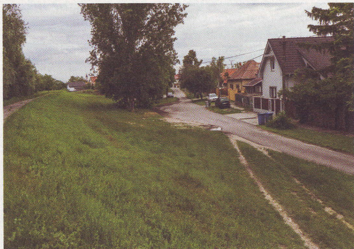
Tam, kde sa teraz nachádza altánok, k domom sa dostali iba člnkami.

Celá republika sleduje zatopený Juh Slovenska – písali v júni roku 1965 na titulných stranách slovenské médiá. Bez strechy nad hlavou sa ocitlo 60 tisíc ľudí. Začína sa organizovať pomoc pre južné Slo-