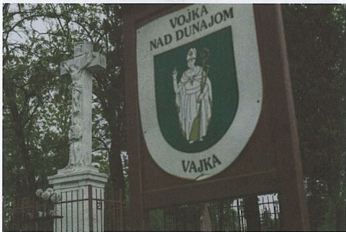
Vajka címerében Szent Adalbert püspök látható. Ő keresztelte és bérmálta meg a községünk névadójaként tisztelt Vajkot, akit a történelem az első magyar királyként, Szent Istvánként tart számon.