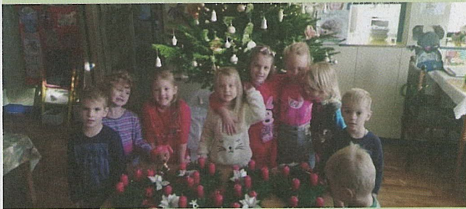
Deti v predvianočnom období si sami vyrobili vo vianočnej tvorivej dielni adventné ozdoby a darčeky pre svojich rodinných príslušníkov. Táto aktivita sa konala v rámci úspešného projektu, ktorú iniciovalo a financovalo Združenie Rákóczi.

Kontakty obecnej materskej školy telefón: 031/55 48 146, e-mail: msvojkanaddunajom@gmail.com