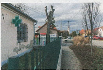
Schátrať bývalú budovu obecného úradu v centre obce treba čím skôr obnoviť.