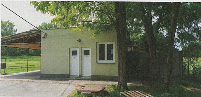
V prednej časti budovy bude ordinovať zverolekár, v zadnej časti sociálne miestnosti po obnove budú využívať turisti kempingu. Kempingový tábor bude v teréne za futbalovým ihriskom.