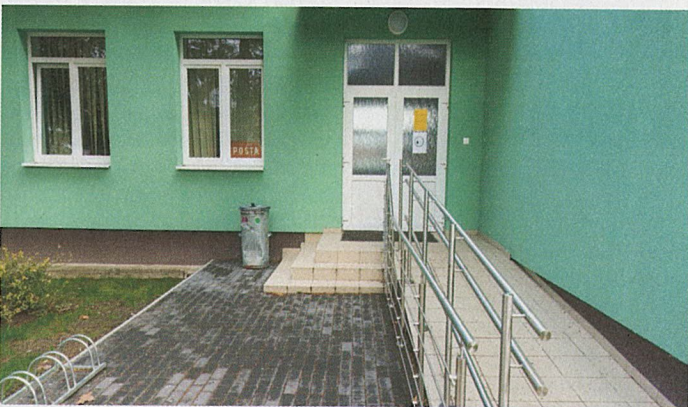
Pošta v priestoroch na obecnom úrade pracuje v neporovnateľne modernějších podmienkach, ako predtým.