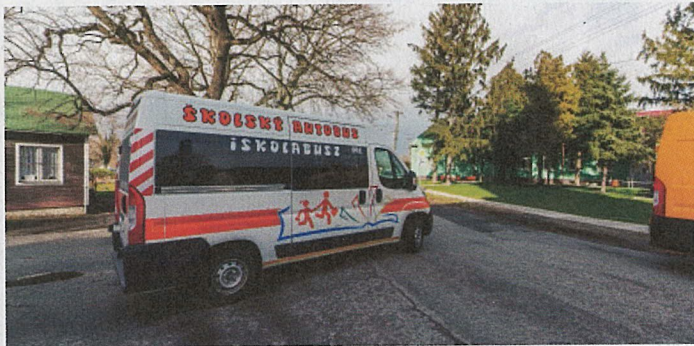
Prieskum sa týkal aj cestovného poriadku mikrobuse, ktorý prevádzkuje susedná obec.

Aj obec má k dispozícii presné údaje o počtoch cestujúcich na obecnom mikrobuse, kým v roku 2020 ešte bol prevádzkovaný. Aj táto štatistika svedčila o veľmi nízkom počte cestujúcich. Spoje smerom do Šamorína by sa dalo prevádzkovať s väčšou efektívnosťou, ak by rapídne zvýšili cenu cestovného lístka. „Zabezpečenie autobusového spojenia ani vtedy, ani v súčasnosti nie je vecou dobrej vôle, ale je to predovšetkým otázka peňazí“ – povedal starosta. Otázka sa môže vynárať podľa starostu aj v tej podobe, či sú občania ochotní zaplatiť vyššie dane, aby obec mala potrebné zdroje na vyfinancovanie prevádzky autobusovej dopravy. A to sa týka aj obecného mikrobuse, aj stratových spojov SAD. Iné príjmy, ako dane, obec nemá k dispozícii, nakoľko až 70 percent katastra obce sú vodné plochy, alebo pozemky, ktoré nepodliehajú zdaneniu, medzi nimi aj lesy, patriace do chránenej krajinej oblasti. Čiže dane