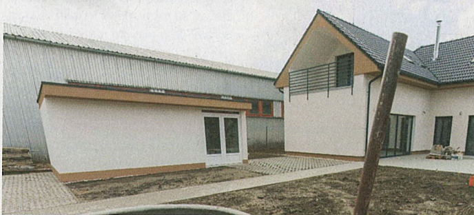
Stavebné práce a úprava terénu sú už vo finiši a onedlho pribudne nová kaviareň, cukráreň a zmrzlináreň pod jednou strechou.

V roku 2020 toto najvýznamnejšie podujatie obce pre pandémiu Covid-19 bolo zrušené, ale v minulom roku sme ho mohli zorganizovať už po sedemnástykrát. Organizátori už začali zostavovať tohoročný program, o podrobnostiach budeme informovať v ďalšom čísle novín.