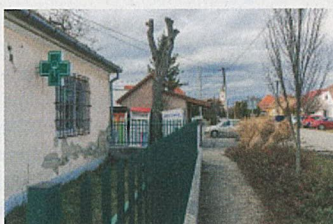
Schátrať bývalú budovu obecného úradu v centre obce treba čím skôr obnoviť.